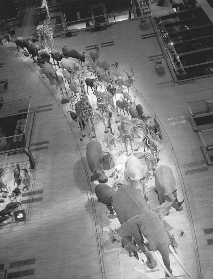
Abb. 1: La Grande Galerie de l'Évolution (Paris)

Ähnliches gilt für den Umgang des antiken Menschen mit den Hervorbringungen des Bodens, den er mit Hilfe des Hakenpflugs, der Sichel und der Wurfabel bearbeitete. Die Rede ist von elementaren Kulturtechniken, die über Jahrtausende konstant geblieben sind und die Zeugnisse für den lebendigen Zusammenhang von Mensch, Natur und Kultur sind. Dieser Zusammenhang ist nach einer